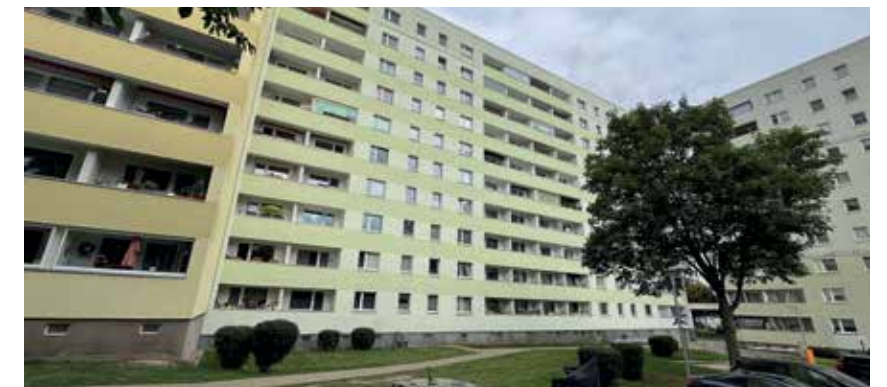
Umfangreiche Sanierungsarbeiten finden im kommenden Jahr auch im Bördebogen 6-7 und 8-9 statt.

Revision stellt die MWG im Jahr 2026 insgesamt 4.37 Millionen Euro bereit. Die Instandsetzung von Leerwohnungen bei Neuvermietung lässt sich unsere Genossenschaft 2026 über 8,1 Millionen Euro kosten. Diese Aufwendungen sind zwingend notwendig, um frei gewordene Wohnungen umgehend neu zu vermieten.