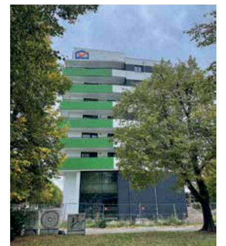
Endspurt beim Neubauprojekt in der Victor-Jara-Straße.

Im Rahmen einer neuen strategischen Ausrichtung der MWG für die nächsten fünf bis zehn Jahre bereiten Vorstand, Technik und Vertrieb ein Konzept vor, das Sanierung, Modernisierung, Neubau, Dekarbonisierung und Nachhaltigkeit gleichermaßen berücksichtigt und die MWG zukunftssicher aufstellen wird.