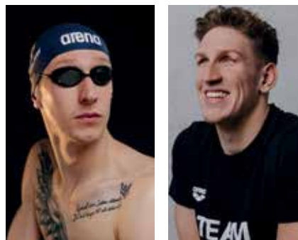
Magdeburger Schwimmstars: Florian Wellbrock (l.) und Lukas Märten.