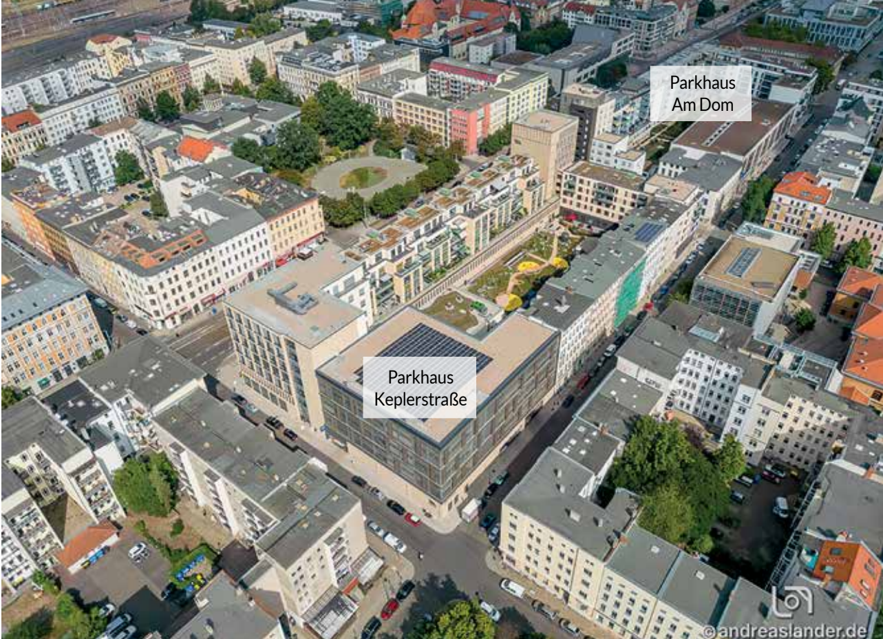
Das neue Domviertel bietet zwei großzügige und preiswerte Parkhäuser - einmal das der Wobau in der Keplerstraße nahe am Hasselbachplatz, zum anderen das der MWG in direkter Domplatznähe.

Adresse: Café Domschatz Breiter Weg 261 Kontakt: Tel: 0391 - 99 04 99 99 Mail: info@cafe-domschatz.de Öffnungszeiten: Dienstag - Sonntag 09:00-18:00 Uhr Kapazität: 100 Plätze im Café 60 Plätze auf der Terrasse Angebot: Frühstück, wechselnde Mittagskarte, Außer-Haus-Catering, private Feiern, öffentliche Veranstaltungen