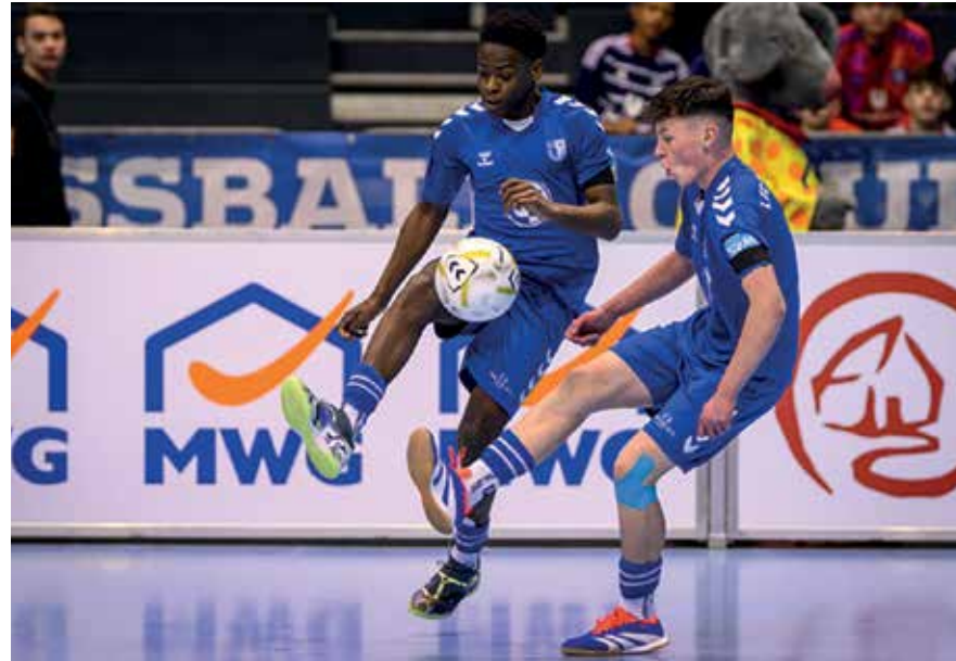
Das Pape-Cup U15-Turnier findet wieder vom 10. bis 11. Januar 2026 statt.

Neben der Profimannschaft unterstützt die MWG auch den Nachwuchs im HB-Im-