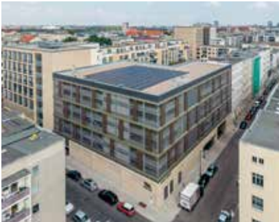
Das Wobau-Parkhaus Keplerstraße kann mit günstigen Kombipreisen Parken & Laden überzeugen.

scheidet, kann bereits ab 3,30 Euro pro Tag sein Auto abstellen. Ein perfektes Angebot für Beschäftigte rund um das Domviertel. Für Interessenten an Dauerparkplätzen gibt es folgende Ansprechpartner: Parkhaus „Am Dom“: