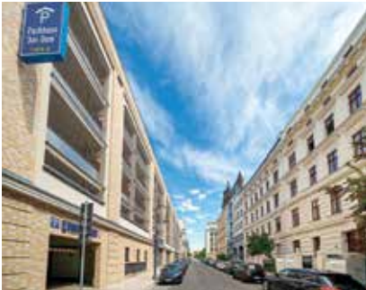
Das MWG-Parkhaus „Am Dom“ punktet mit Übersichtlichkeit und günstigen Preisen.

Gerade jetzt in der Weihnachtszeit ist die Parkplatzsuche in der Innenstadt oft langwierig. Machen Sie es sich leicht - fahren Sie direkt zum Domviertel. Beide Parkhäuser bieten Innenstadtbesuchern eine stressfreie Platzsuche, eine 24-stündige Verfügbarkeit, Sicherheit durch Videoüberwachung und regelmäßige Kontrollen, breite und gut markierte Parkflächen, Witterungsschutz, Barrierefreiheit und moderne Zahlungsmöglichkeiten: Während im Parkhaus „Am Dom“ per Karte gezahlt werden kann, ist dies im Parkhaus „Keplerstraße“ weiterhin mit Bargeld möglich. Beide Parkhäuser bieten E-Ladestationen für Elektrofahrzeuge und attraktive Preise im Vergleich zu anderen Optionen in der Innenstadt an. Es sind sowohl Kurzzeit- als auch Dauerparkplätze verfügbar. Autofahrer zahlen für das Kurzzeitparken 1 Euro bzw. 1,50 Euro pro Stunde. Wer sich für einen Dauerparkplatz ent-