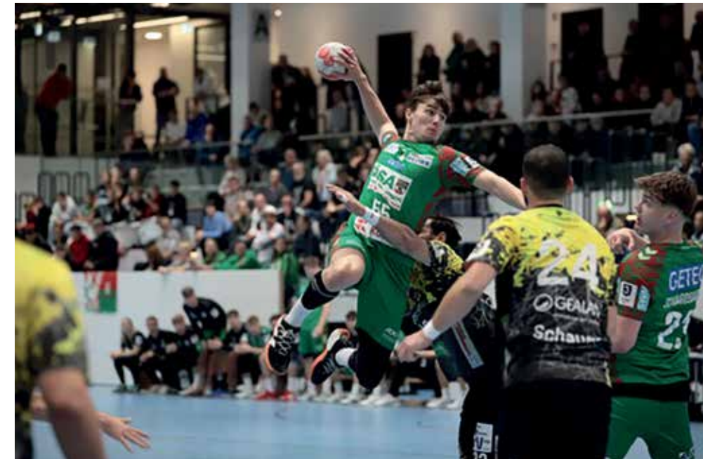
Die YoungsterS des SCM spielen in der 3. Liga und haben ihr Wohnzimmer in der neuen Wolfgang-Lakenmacher-Halle. Dort ist der Eintritt sogar immer frei.

Auch auf der Platte ist die MWG präsent: Seit Jahren unterstützt sie den SC Magdeburg im Handball – eine der erfolgreichsten Mannschaften Europas. Hier zeigt sich, wie stark Sport und Gemeinschaft zusammenwirken: Jedes Heimspiel in der GETEC Arena ist ein Stück Magdeburger Lebensfreude, getragen von Fans, die gemeinsam jubeln, fiebern, feiern. Viele davon auf der MWG-Familientribüne.