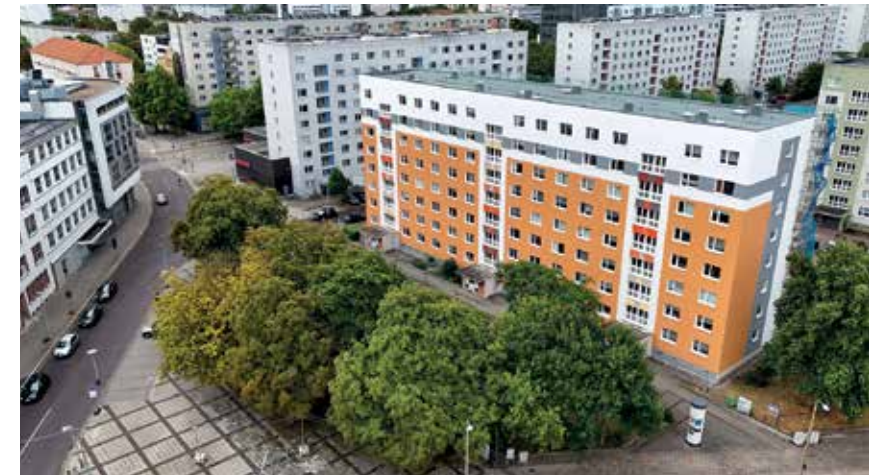
Die komplexe Sanierung der Erzbergerstraße 20-22 geht 2026 in ihr zweites und letztes Jahr. Dann werden noch alle Aufzüge barrierefrei umgebaut.

Der Bau von Feuerwehruzufahrten für die Otto-Nagel-Straße 4-6 und für die Othrichstraße 13-18. Insgesamt investiert die MWG für diese wichtige Sicherheitsmaßnahme 613.000 Euro. Für die Instandhaltung und Instandsetzung sowie für die Wartung und